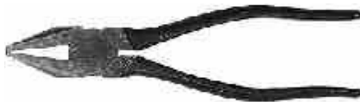
32 135 00 Brechzange, 160 mm L., 12 mm Backenbreite, ummantelter Griff Breaking pliers, 160 mm, 12 mm jaw width, coated grip