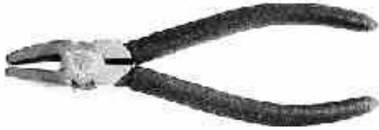
32 134 00 PROVETRO Fischlippen-Kröselzange PCJ-8, ummantelter Griff 5 mm Backenbreite (ideal für 2 - 5 mm Glas) Grozers pliers "fishlip", coated grip, 5 mm jaw width, for 2 - 5 mm glass