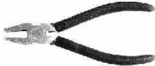
32 132 00 PROVETRO- Brechzange PCJ-3, 165 mm L., 10 mm Backenbreite, (ideal für 2 - 6 mm Glas) Breaking pliers, 165 mm, 10 mm jaw width, for 2 - 6 mm glass