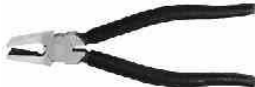
32 133 00 PROVETRO- Brechzange PCJ-4, 22 mm Backenbreite , (ideal für 2 - 12 mm Glas) Breaking pliers PCJ-4, 22 mm jaw width, for 2 - 12 mm glass