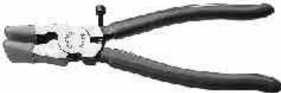
32 115 00 PROVETRO Laufzange / Running pliers PRP-1 Metall, 205 mm L., 24 mm Backenbreite, mit Stellschraube, Griff und Backen ummantelt, (ideal für 2 - 6 mm Glas) Metal, 205 mm, 24 mm jaw width, leveling screw, coated grip and jaw

32 150 02 Ersatzteller für 700.0 / Repl. jaw for 700.0, disc