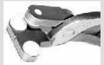
Detailansicht 32 117 00