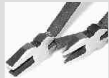
Detailansicht der PROVETRO-Zangen PCJ-3 (32 132 00) und PCJ-8 (32 134 00).

can start cuts especially gently and controlled. Complicated curved cuts can be achieved additionally.