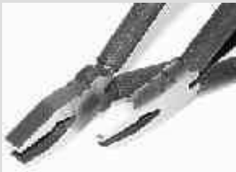
Detailansicht der PROVETRO-Zangen PCJ-1 (32 130 00) und PCJ-5 (32 131 00).

We have considerably extended the range of our products especially for glaziers, the glass industry and all companies incorporating the use of thick glass.