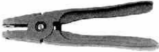
32 111 00 RING STAR Laufzange / RING STAR running pliers Kunststoff / Synthetic

32 111 01 Ersatzbacken für RING STAR / Repl. jaw for RING STAR