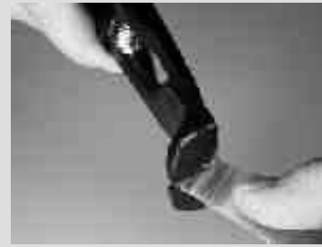
Detailansicht 32 165 00