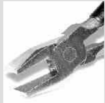
Detailansicht 32 118 00