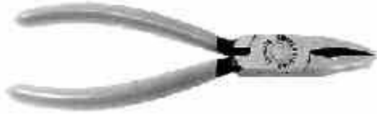
KNIPEX Brech- und Kröselzange, 160 mm L., ölgehärtete Backen, ummantelter Griff

Breaking and grozing pliers, oil tempered jaw, coated grip