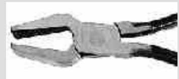
Detailansicht 32 118 30