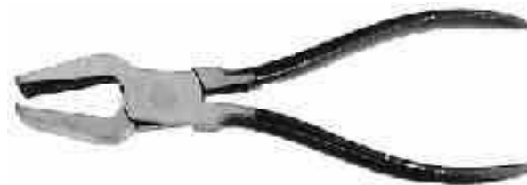
32 118 30 PROVETRO Dickglas Brechzange / Pliers for thick glass P-510 210 mm L., 23 mm Backenbreite, ummantelter Griff (ideal für 3 - 16 mm Glas) 210 mm, 23 mm jaw width, coated grip, for 3 - 16 mm glass