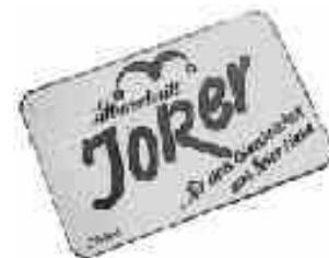
36 165 00 JOKER Brechhilfe Breaking tool