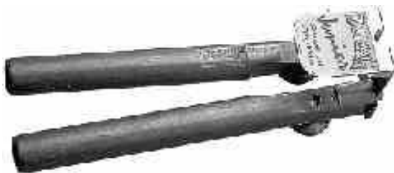
00 311 00 ZAG-ZAG Mosaik-Zange / Mosaic pliers "Junior" 703.5