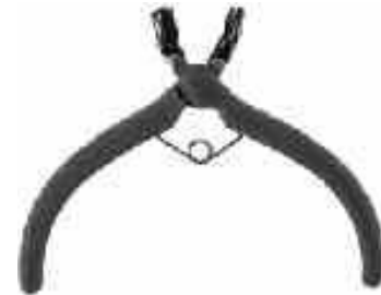
32 104 00 Dreipunktzange Runnig pliers TINY BREAKER Metall, Griff und Backen ummantelt metal, coated grip and jaw

32 101 01 Ersatzbacken für / Repl. jaw for BLUE RUNNER