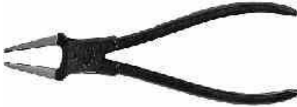
32 140 00 KNIPEX Brechzange, 180 mm L., 22 mm Backenbreite, er- leichtert das Brechen schmaler Streifen Breaking pliers, 180 mm, 22 mm jaw width, easy breaking of small stripes