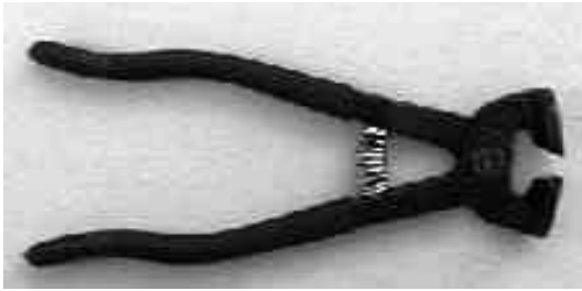
32 165 00 Mosaik-Zange / Mosaic plier