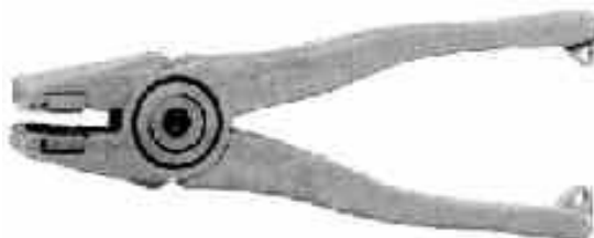
32 101 00 BLUE RUNNER Laufzange / BLUE RUNNER running pliers Kunststoff / Synthetic

32 115 11 Backenschuh für 32 115 00 / Repl. tip for 32 115 00