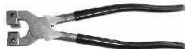
32 117 10 PROVETRO Dickglas Laufzange / Pliers for thick glass PRP-4 230 mm L., 50 mm Backenbreite, ummantelter Griff (ideal für 2 - 19 mm Glas) 230 mm, 50 mm jaw width, coated grip, for 2 - 12 mm glass