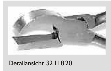
Detailansicht 32 118 20

32 118 20 PROVETRO-Spiegelbrechzange / Breaking pliers for mirrors P410 185 mm L., 15 mm Backenbreite, ummantelter Griff (ideal für 3 - 16 mm Glas) 185 mm, 15 mm jaw width, coated grip, for 3 - 16 mm glass