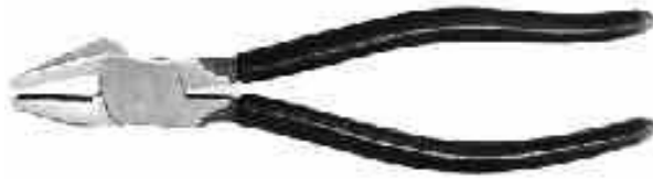
32 118 00 PROVETRO Dickglas Brechzange / Pliers for thick glass P-210 220 mm L., 22 mm Backenbreite, ummantelter Griff (ideal für 5 - 12 mm Glas) 220 mm, 22 mm jaw width, coated grip, for 5 - 12 mm glass