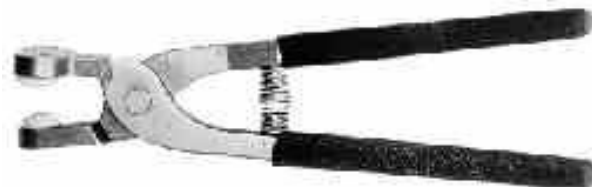
32 117 00 PROVETRO Dickglas Laufzange / Pliers for thick glass PRP-2N 230 mm L., 45 mm Backenbreite, Backen mit Kunststoff belegt, ummantelter Griff (ideal für 6 - 16 mm Glas) 230 mm, 45 mm jaw width, synthetic tips, coated grip, for 6 - 16 mm glass