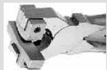
Detailansicht 32 117 10