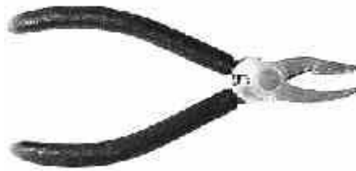
Brech- und Kröselzange, 155 mm, ummantelter Griff, (ideal für 2 - 5 mm Glas)

32 127 00 4 mm Backenbreite / jaw width, mit Rückstellfeder / spring return