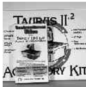
31 365 20 Ergänzungssatz Accessory kit