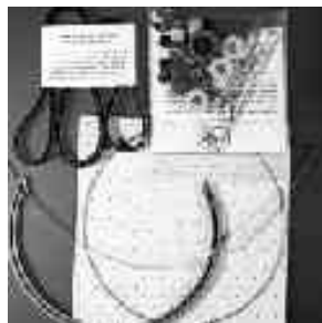
31 365 19 Ersatzteilset Replacement kit