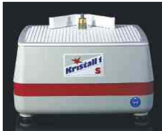
30 102 50 KRISTALL IS (Powermotor) 280 x 235 mm Arbeitsfläche / work surface, 100 W, 2800 U/min, Präzisionskugellager / precision ball bearings, incl. Thermoschutz / thermal protection, Spritzschutz / splash guard und 19 mm Schleifkopf / diamond bit