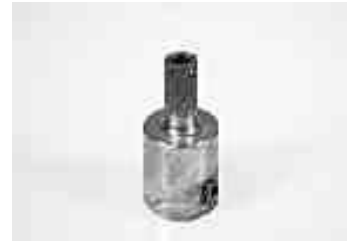
INLAND-Hohl-Schleifdorn, 6 mm Diamond bit, 1/4" 30 406 00 Standard / standard 30 406 01 Fein / fine 30 406 03 Speed / speed