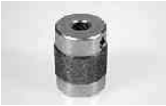
Schleifkopf / Diamond bit 1" = 25 mm 30 201 00 grob / rough 30 201 01 fein / fine 30 201 03 Power 30 201 04 Superpower 30 201 05 Turbo