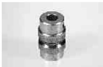
Spiegelschleifer, 19 mm Mirror bit, 3/4" 30 207 00 grob / rough 30 207 01 fein / fine