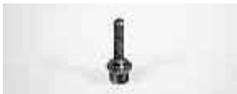
Schraubschleifdorn für Adapter 3021100 Screwed diamond bit for Adaptor 3021100