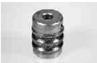
Spiegelschleifer, 25 mm Mirror bit, 1" 30 206 00 grob / rough 30 206 01 fein / fine