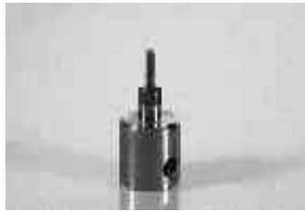
30 208 05 Schleifdorn, 2 mm + 6 mm Diamond bit, 2 mm + 6 mm