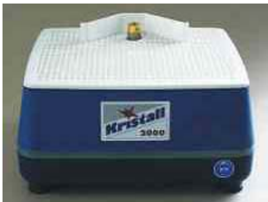
30 101 00 KRISTALL 2000 280 x 235 mm Arbeitsfläche / work surface, 170 W, 2255 U/min, Präzisionskugellager / dual precision ball bearings, eingebaute Schleifwasserpumpe / built in grinding water pump, incl. Thermoschutz / thermal protection, Spritzschutz / splash guard und 19 mm Schleifkopf / diamond bit