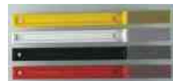
30 505 00 Diamant Glasfeilen Set Diamond grinding files set 150, 200, 380, 700 Körnung / Grid