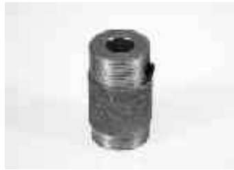
INLAND-Schleifkopf, 19 mm Diamond bit, 3/4" 30 400 00 Standard / standard 30 400 01 Fein / fine 30 400 04 Speed / speed 30 400 05 Super / super 30 400 07 Rippel / ripple 30 400 08 Lampen / lamps 30 400 11 Superspeed