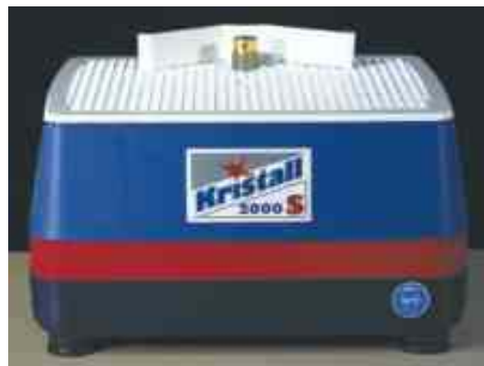
30 101 50 KRISTALL 2000S (Powermotor) 280 x 235 mm Arbeitsfläche / work surface, 100 W, 2800 U/min, Präzisionskugellager / dual precision ball bearings, eingebaute Schleifwasserpumpe / built in grinding water pump, incl. Thermoschutz / thermal protection, Spritzschutz / splash guard und 19 mm Schleifkopf / diamond bit