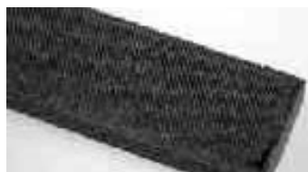
30 501 00 Carborundum Glasfeile, HCBS Carborundum file, HCBS 247 x 38 x 10 mm