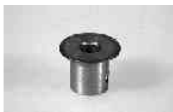
30 230 00 Rillenschleifer, 25 mm / 1 mm Grooving diam. bit, 25 mm / 1 mm