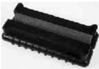
30 502 00 Carborundum Handentgrater Carborundum deburrer, HDHS für 3-15 mm Glass, 3-15 mm glass