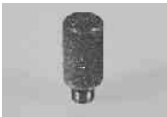
30 214 03 Power 10 mm