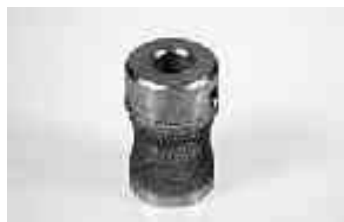
Gehrungsschleifer, 9° / 18°, 19 mm Lamp bit, 9° / 18°, 3/4" 30 208 00 grob / rough 30 208 01 fein / fine