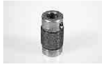
Schleifkopf / Diamond bit 5/8" = 16 mm 30 203 00 grob / rough 30 203 01 fein / fine 30 203 03 Power 30 203 04 Superpower