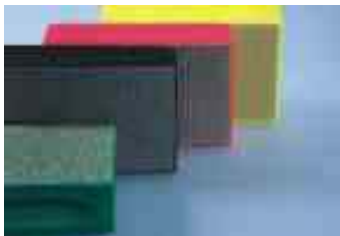
Diamant Schleifklotz Diamond grinding pad 30 504 00 grün/green 70 30 504 01 schwarz/black 150 30 504 02 rot/red 200 30 504 03 gelb/yellow 380