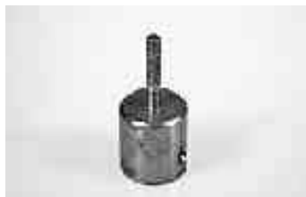
Schleifdorn / Diamond bit, 3 mm 30 209 00 grob / rough 30 209 01 fein / fine 30 209 03 Power 30 209 04 Superpower