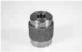
GLASTAR-Schleifkopf, 25 mm Diamond bit, 1" 30 300 00 Standard / standard 30 300 01 Fein / fine