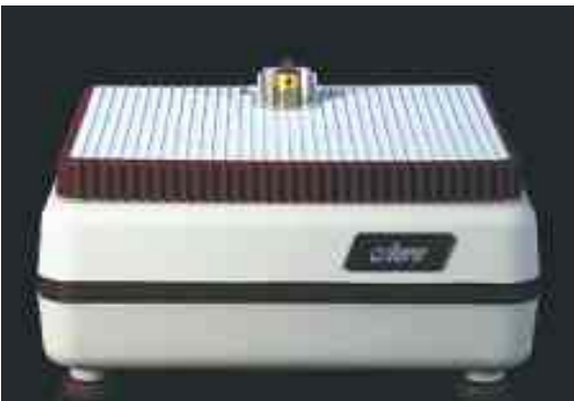
30 116 00 INLAND AERO 230 x 255 mm Arbeitsfläche / work surface (beidseitig verwendbar / double sided), 3450 U/min, Thermoschutz / thermal protection, incl. 19 mm Schleifkopf / bit, TouchTop - Schalter / switch