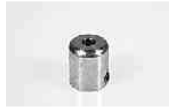
30 307 00 GLASTAR-Dornadapter Adaptor 1/4", 1/8"