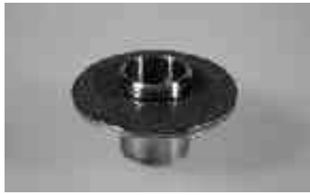
Facettschleifer / Bevel bit grob / rough