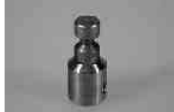
30 207 02 Spiegelschleifer, 10 mm, fein Mirror bit, 10 mm, fine