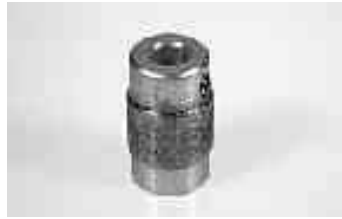
Schleifkopf / Diamond bit 3/4" = 19 mm 30 202 00 grob / rough 30 202 01 fein / fine 30 202 03 Power 30 202 04 Superpower 30 202 05 Turbo