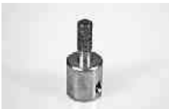
Schleifdorn / Diamond bit, 6 mm 30 204 00 grob / rough 30 204 01 fein / fine 30 204 03 Power 30 204 04 Superpower 30 204 05 mit Loch / with hole 30 204 06 Turbo