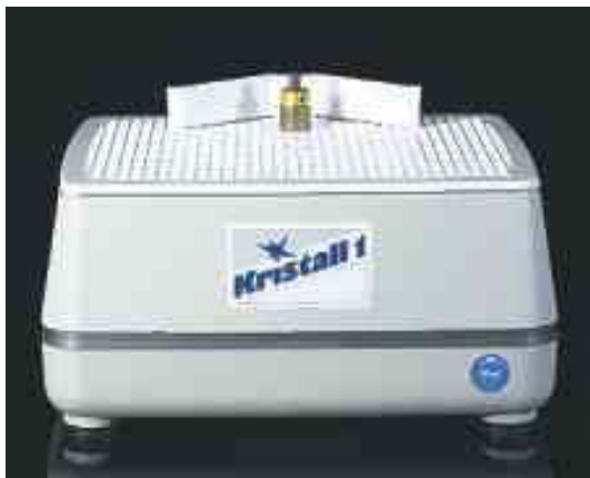
30 102 00 KRISTALL I 280 x 235 mm Arbeitsfläche / work surface, 170 W, 2255 U/min, Präzisionskugellager / precision ball bearings, incl. Thermoschutz / thermal protection, Spritzschutz / splash guard und 19 mm Schleifkopf / diamond bit