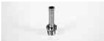
Diamant Hohlbohrer mit Außenkühlung für Adapter 30 211 00 Diamond core drill bit with outer cooling for Adaptor 30 211 00