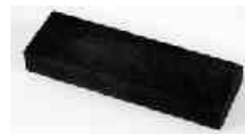
30 500 00 Carborundum Glasfeile / Glass file