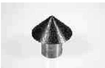
Entgrater, 35 mm / Deburrer, 35 mm 30 224 00 grob / rough 30 224 01 fein / fine