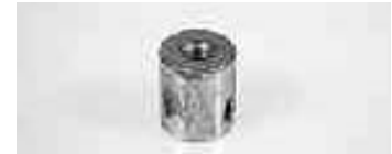
30 211 05 Adapter für Schleifstifte, G51 Adap. for screwed diam. bits, G51