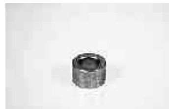
Schleifdorn / Diamond bit, 16 mm für Schleifmaschine G5 I 30 205 00 grob / rough 30 205 01 fein / fine 30 205 03 Power 30 205 04 Superpower