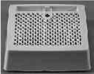
30 107 06 Universal Minitisch / Universal mini table

GLASTAR-Schleifköpfe finden Sie unter den Artikelnummern 30 300 00 bis 30 308 00. For original GLASTAR grinding bits see the article numbers 30 300 00 to 30 308 00.