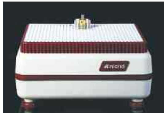
30 120 00 INLAND CONTOUR 230 x 255 mm Arbeitsfläche / work surface (beidseitig verwendbar / double sided), 3450 U/min, Thermoschutz / thermal protection, incl. 19 mm Schleifkopf / bit