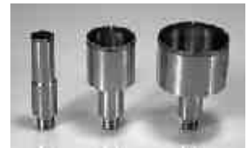
Glasbohrer mit Innenkühlung für Bohrsystem drill bit with inner cooling for drilling system