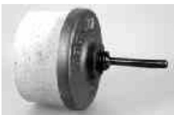
30 550 00 Polieret für Bohrmaschine Polishing set for drilling machine