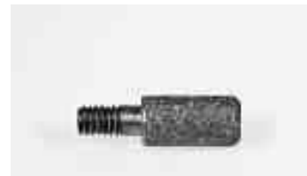
GLASTAR-Schleifdorn, Standard Diamant bit, standard 30 306 00 6 mm / 1/4" 30 308 00 3 mm / 1/8"