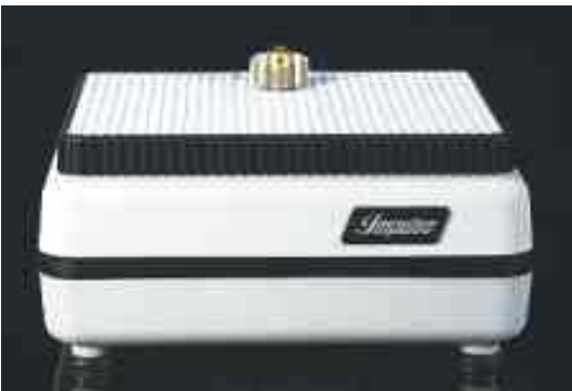
30 117 00 INLAND IMPULSE 230 x 255 mm Arbeitsfläche / work surface (beidseitig verwendbar / double sided), 3500 U/min, Thermoschutz / thermal protection, incl. 25mm u. 6mm Schleifkopf / bit, Touch Top-Schalter / switch